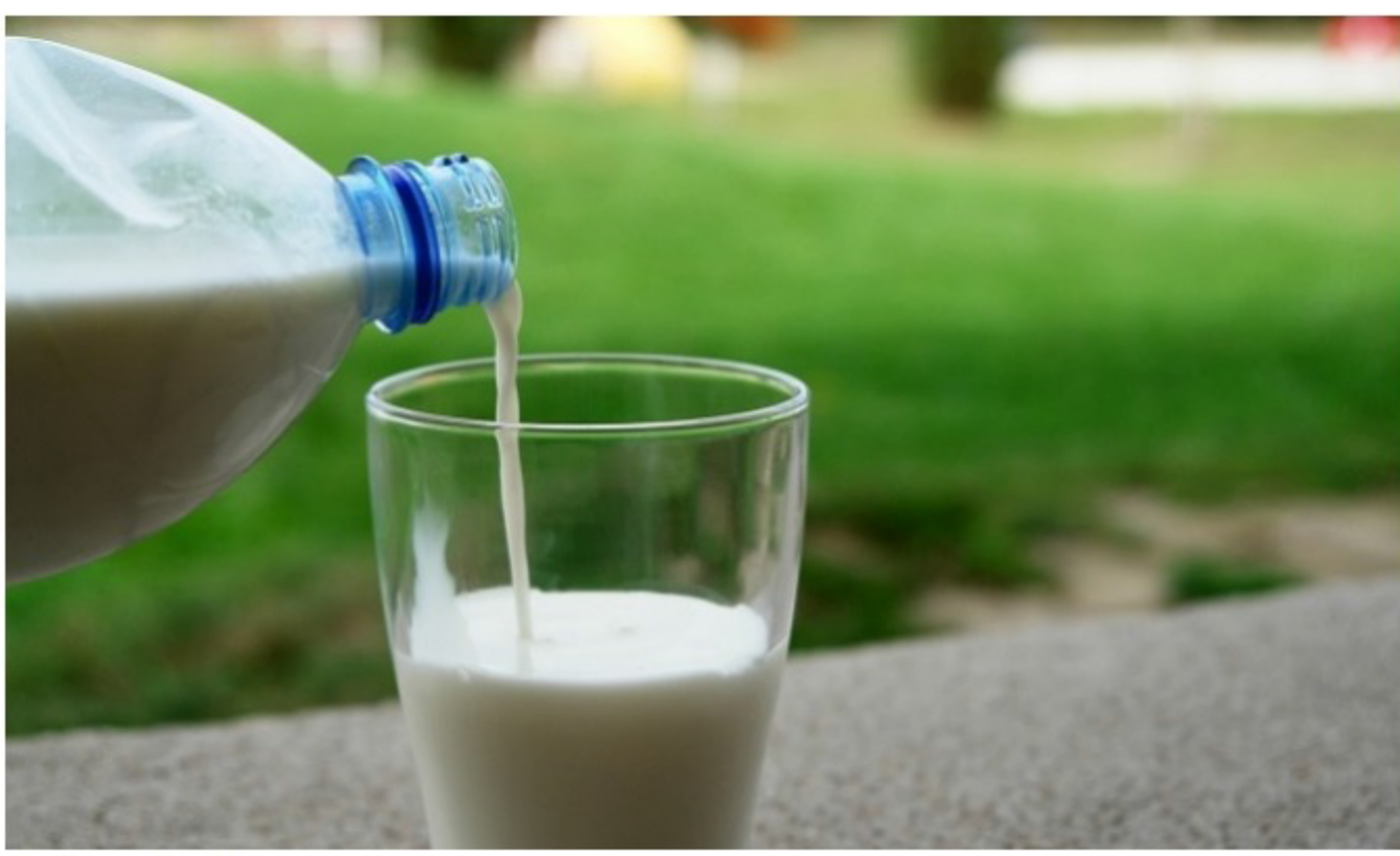
Cada tipo de lácteo lleva una cantidad diferente de lactosa.

Vote este artículo (0 votos) Imprimir | Email | 0 Comentarios