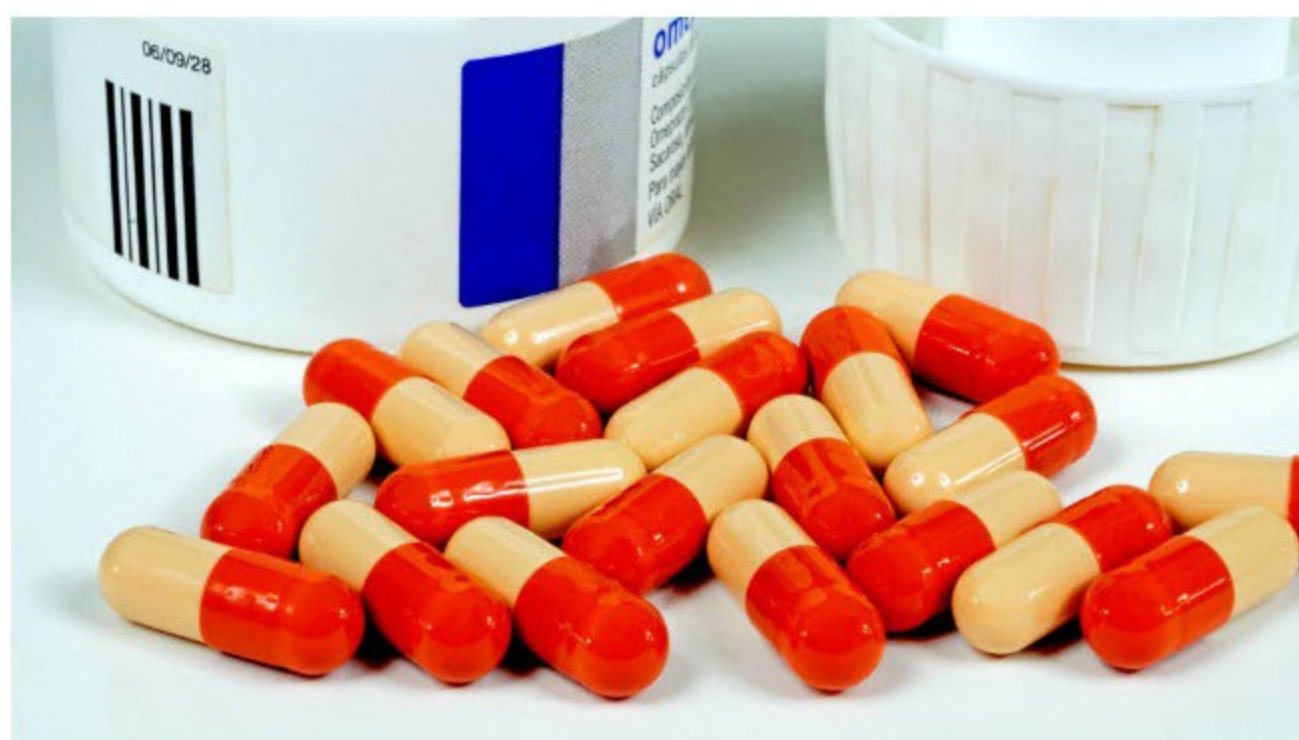
Omeprazol, el medicamento más consumido en España.

C reemos necesitar el omeprazol. Al menos es lo que se puede deducir del último Informe Anual del Sistema Nacional de Salud : representa nada menos que un 6,2% del total de fármacos vendidos en España. Se consume más incluso que el paracetamol y que el ibuprofeno, que están presentes en todos los botiquines de este país. Y no llevamos la delantera estadística en muchos ámbitos, pero sí en este: doblamos la media europea de consumo del medicamento . Viendo estos datos, no es de extrañar que la población lo considere prácticamente inocuo, sobre todo teniendo en cuenta que desde 2016 se puede comprar sin receta.