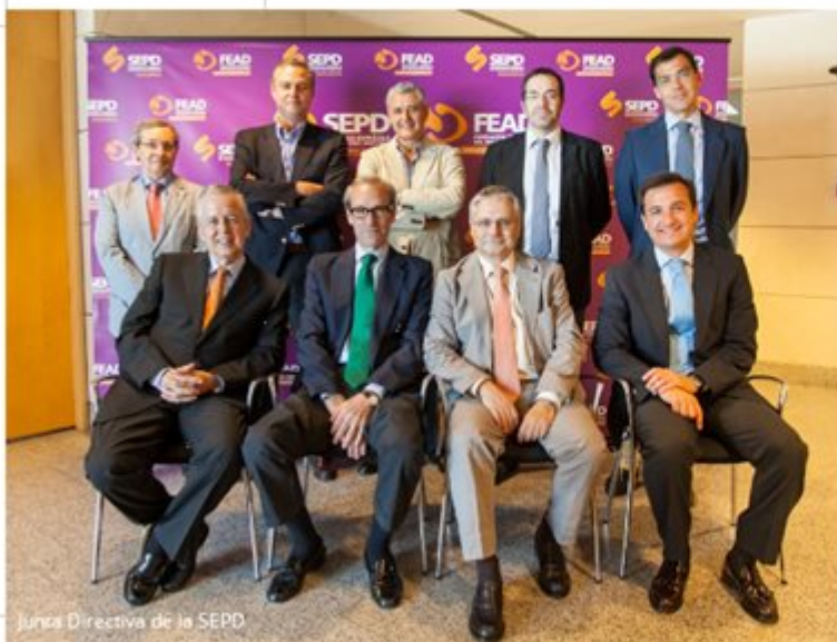
Junta Directiva de la SEPD