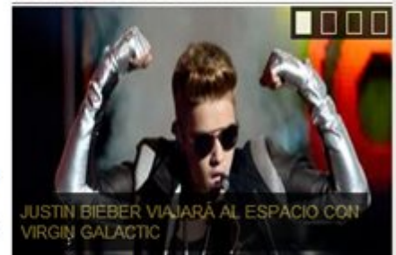
JUSTIN BIEBER VIAJARÁ AL ESPACIO CON VIRGIN GALACTIC