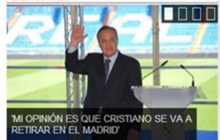
'MI OPINIÓN ES QUE CRISTIANO SE VA A RETIRAR EN EL MADRID'