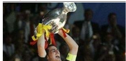
CANDIDATAS CON GANAS DE REVANCHA AMENAZAN EL TRONO DE ESPAÑA