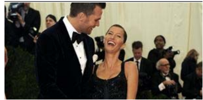
GISELE BÜNDCHEN ESPERA SU SEGUNDO HIJO