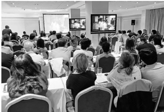
Curso Práctico de Avances en Endoscopia celebrado ayer con sesiones en directo desde Basurto.

Otra de las técnicas que tienen los expertos para mejorar la tolerancia de los pacientes cuando les hacen las pruebas es la insuflación con CO 2 , un gas que es cada vez más utilizado en este tipo de procedimientos. Su principal beneficio es que se reabsorbe rápidamente, con lo cual los enfermos presentan en comparación con la insuflación con aire, significativamente menos molestias tras las exploraciones, "sobre todo en aquellas que requieren un periodo