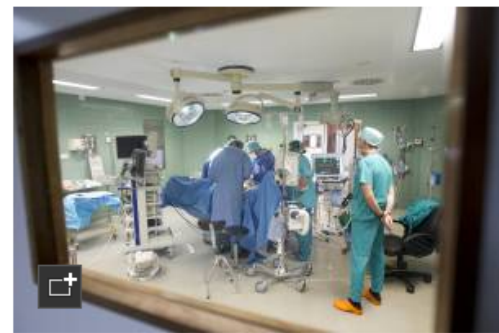
Vista de varios cirujanos durante una intervención en un quirófano.

EFE ECONOMÍA | Madrid | 26 JUL 2012 - 16:10 CET