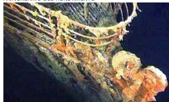
Estado actual de la proa del 'Titanic'.