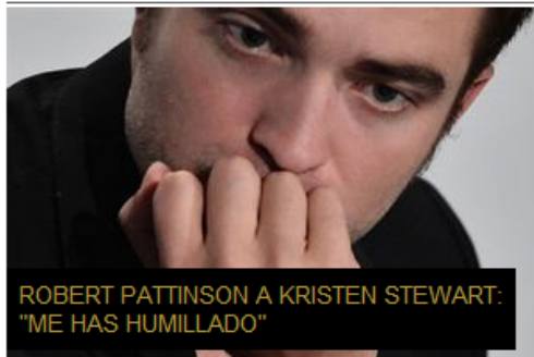
ROBERT PATTINSON A KRISTEN STEWART: "ME HAS HUMILLADO"